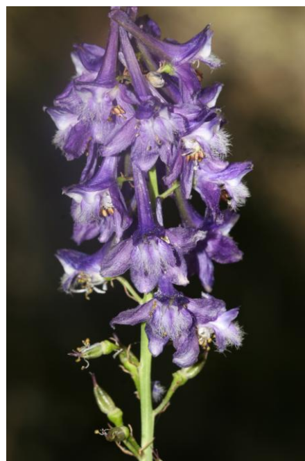
Delphinium fissum_Inflorescence - F. Andrieu, Gorges de la Carança (66) ; juillet 2010

Dans les Pyrénées-Orientales, une ancienne mention signale sa présence en forêt de Campilles, à la Collade, commune de Thuès-entre-Valls (Gautier, 1898).