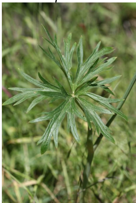
Delphinium fissum_Feuilles de la tige - F. Andrieu, Gorges de la Carança (66) ; mai 2010

C'est une plante élancée d'assez grande taille, dépassant 1 mètre de haut, à inflorescence richement fournie de fleurs bleu-violacé. Elle affectionne les pentes rocailleuses bien exposées et possède une répartition générale couvrant les montagnes du sud de l'Europe et de l'ouest de l'Asie.