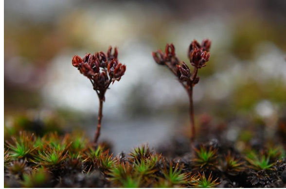
Sedum andegavense -Pied sec – J.M. Lewin, Vallée de la Baillaury (66) ; septembre 2010

Pendant longtemps cette vermiculaire ne fut connue de Catalogne que d'une part d'herbier datant de 1878 (Bolòs & Vigo 1984).