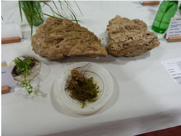
Figure 3 : Cratoneuron commutatum et « pierre tosca »

Sur la table réservée aux « zones humides » étaient posées des pierres légères, creusées de