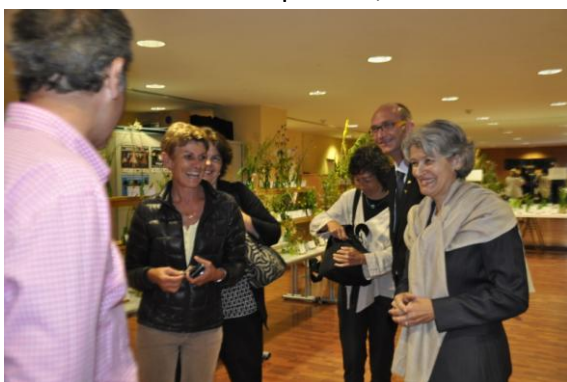
Fig. 5 : Visite de l'exposition botanique SMBCN par Irina Bokova

De notre côté, nous ajoutons quelques mots sur le patrimoine linguistique que constituent les noms catalans de plantes, inscrits sur les étiquettes des présents