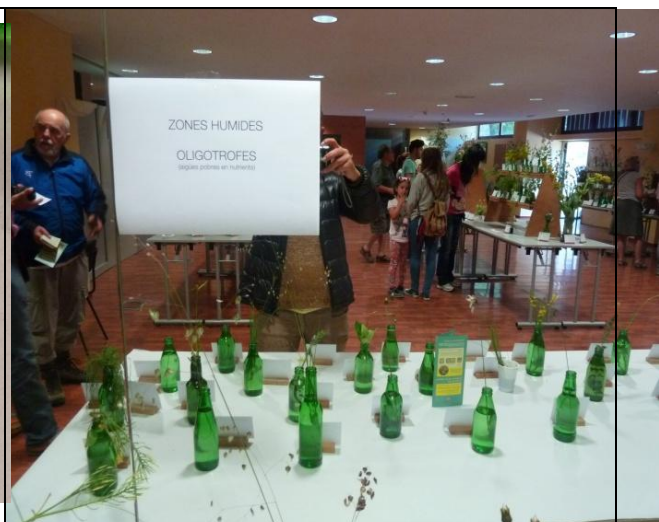
2- Plantes des zones humides oligotrophes (eaux pauvres en nutriments)