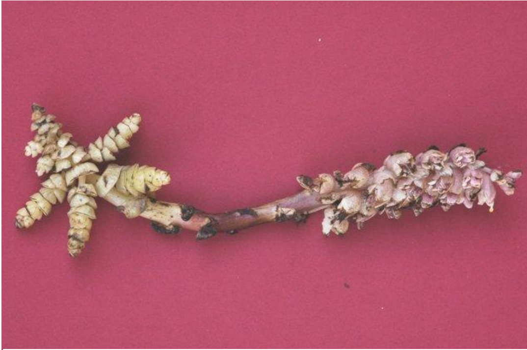
Lathraea squamaria (Corsavy)