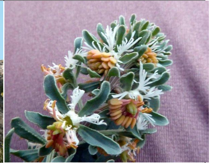
Reseda phyteuma - Roca malera

Les étiquettes n'indiquaient pas toujours le lieu de récolte (signalé comme « non renseigné » à la colonne 5 dans la liste qui suit). Malgré toutes ces carences, générées par la précipitation des lundis richement fleuris, et du temps limité, le nombre des spécimens listés est conséquent.