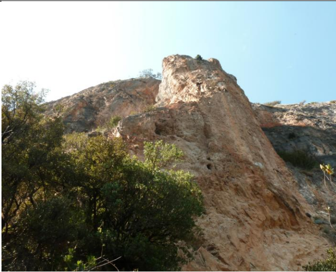
Roca malera (Vallespir)