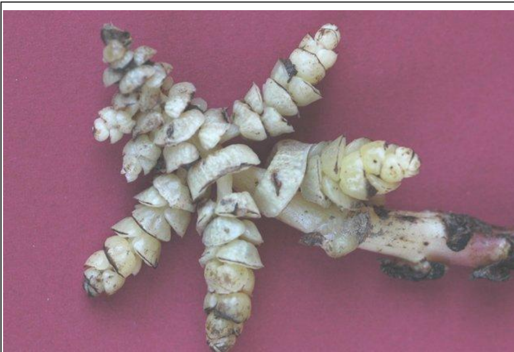
Détails de Lathrea squamaria