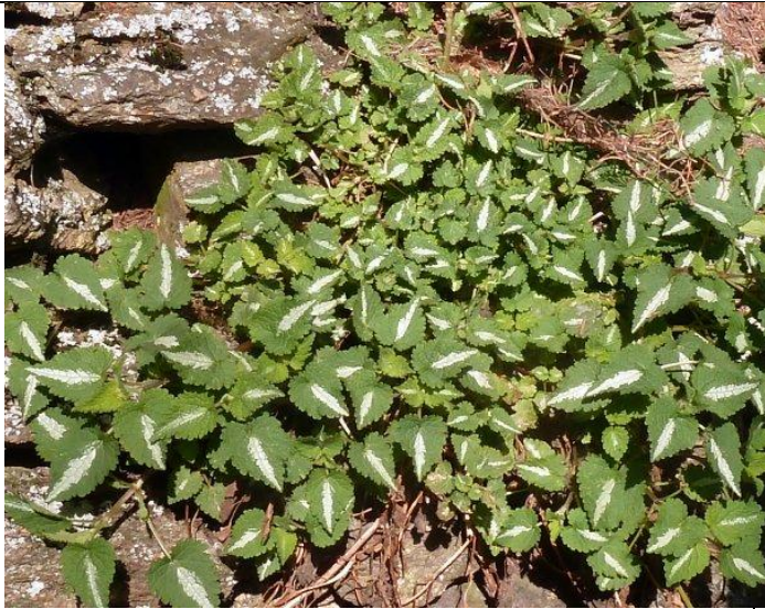
Lamium maculatum – La Llau